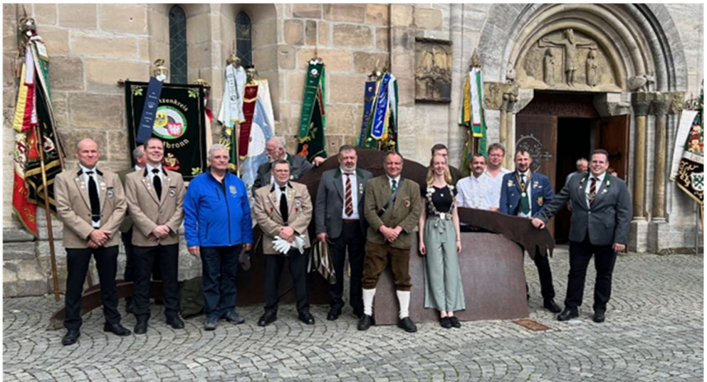
Abordnung des Schützenkreises beim Deutschen Schützentag in Schwäbisch Gmünd

Besuch Informationsveranstaltung WSV Talent- schmieden